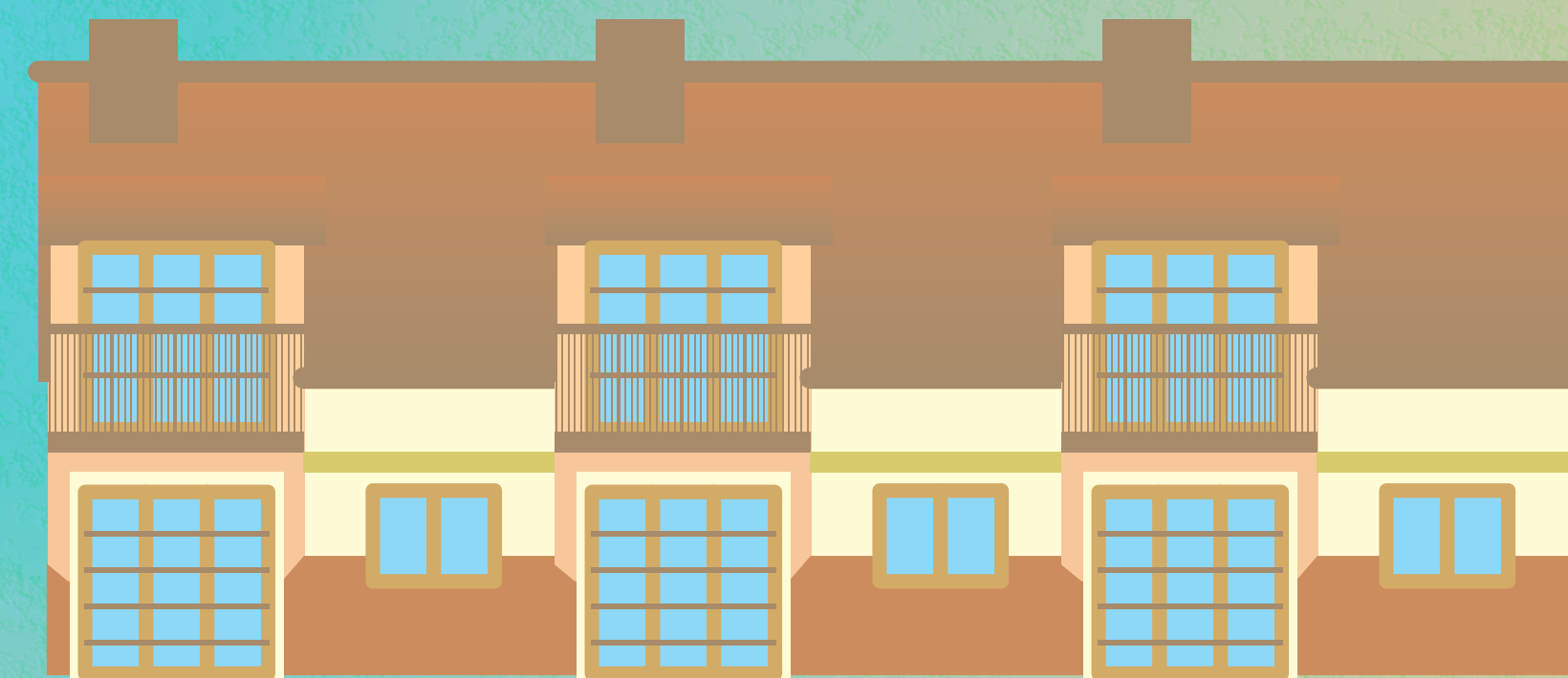
Dom - szeregowiec wielorodzinny